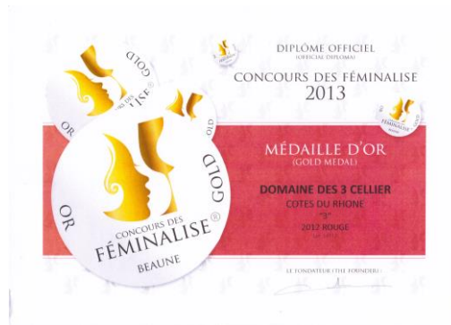
Or Féminalise 2013 Pour 3 2012