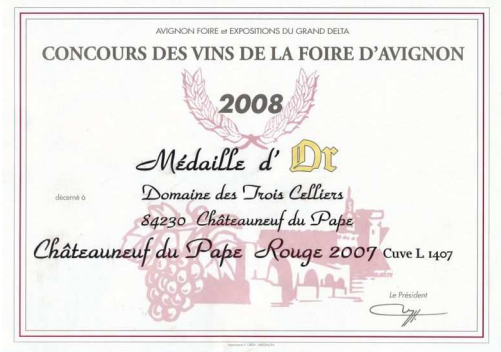
OR Foire Avignon 2008 Pour Privilège 2007