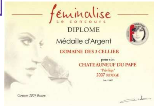
Argent à Féminalise 2009 Pour Privilège 2007