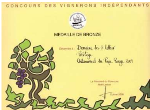
Bronze au Vignerons Indépendant 09 → Privilège 07