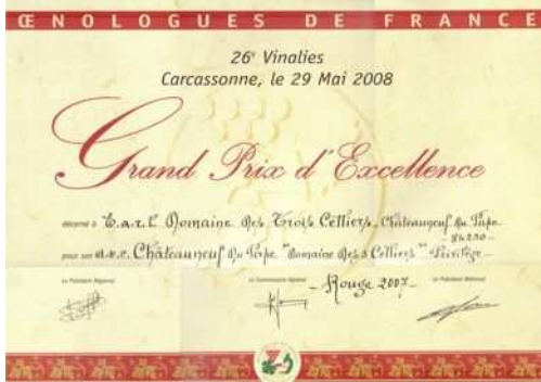
OR aux Vinalies Nationales 2008 → Privilège 07