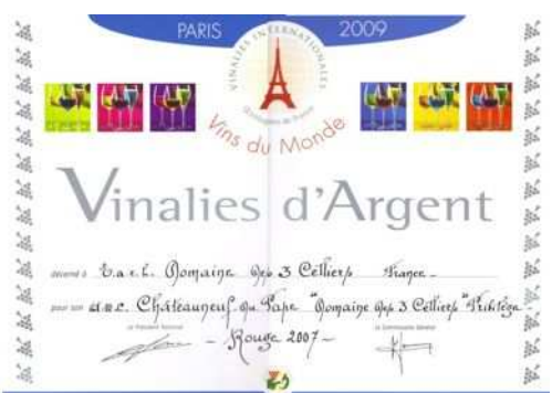
Argent Vinalies Internationales 2009 → Privilège 07