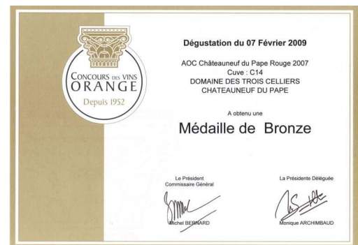
Bronze à Orange 2009 Pour Privilège 2007