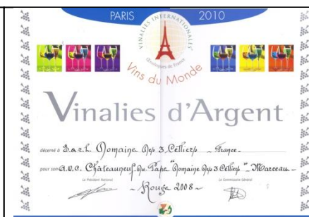
Argent Vinalies Internationales 2010 pour Marceau 2008