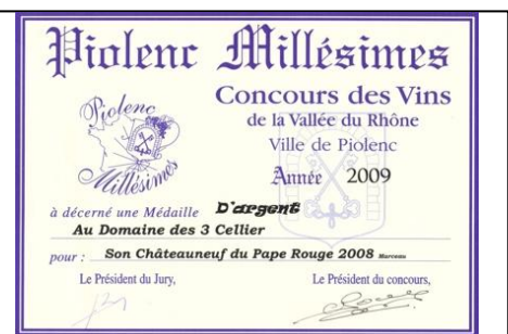
Argent Piolenc 2009 pour Marceau 2008