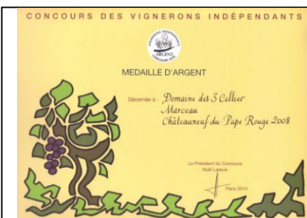
Argent Vignerons Indépendants 10 pour Marceau 2008