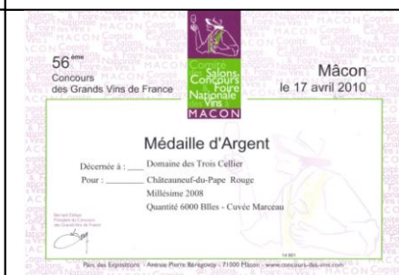
Argent Mâcon 2010 pour Marceau 2008