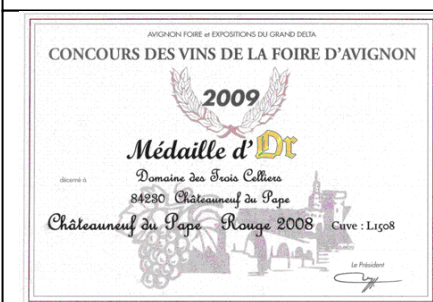
OR Foire Avignon 2009 Pour Marceau 2008