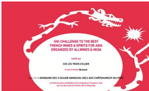
allwines 香港專業品酒師協會 Bronze All Wines Asia 2014 Marceau 2011