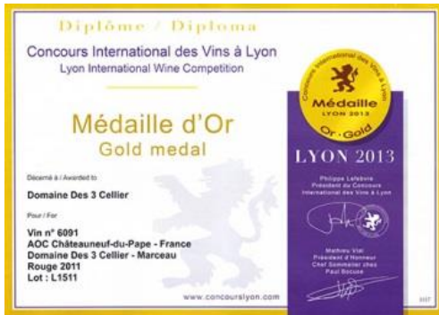
Or Lyon 2013 Pour Marceau 2011