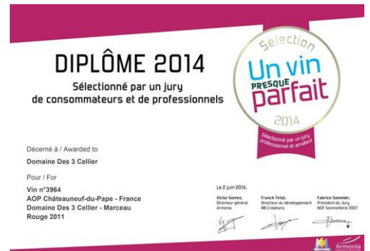
Un Vin Presque Parfait 2014 Marceau 2011