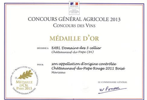
Or Paris 2013 Pour Marceau 2011