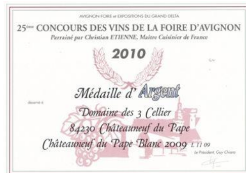
Argent Foire d'Avignon 2010 Pour Insolente 2009