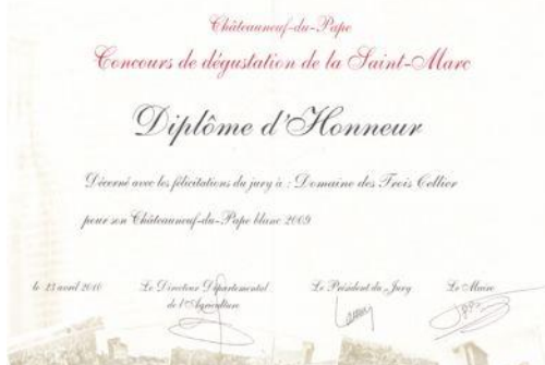
Honneur à la St Marc 2010 Pour Insolente 2009