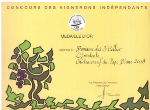
Or Vignerons Indépendants 2010 → Insolente 2009