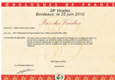
Bronze Vinalies 2010 → Insolente 2009