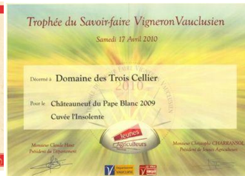
Or Trophée du savoir-faire 10 Pour Insolente 2009