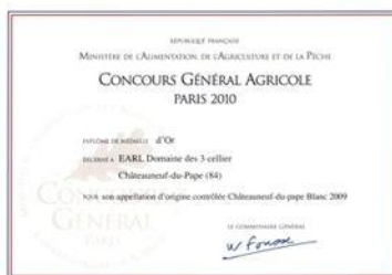
Or CGA Paris 2010 Pour Insolente 2009