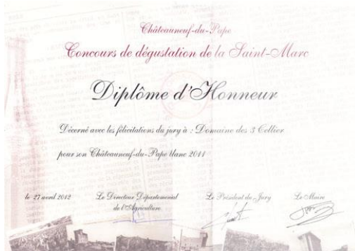
Honneur St Marc 2012 Pour Insolente 2011