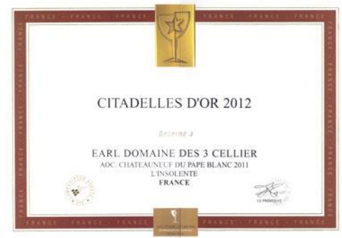
Or Citadelles 2012 Pour Insolente 2011