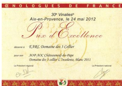
ARGENT Vinalies 2012 Pour Insolente 2011