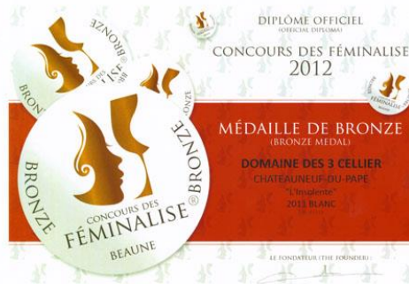
BRONZE au Féminale 2012 Pour Insolente 2011