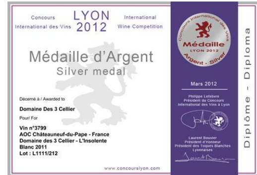
ARGENT à LYON 2012 Pour Insolente 2011